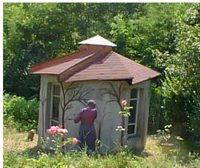
rotonde ou "stranala" sanctuaire de régénération

Les oiseaux, leurs formes, leurs chants, sont une merveilleuse expression de l'HARMONIE. Les paysages, les arbres, les fleurs sont à ceux qui les aiment. Tout cela nous invite à bâtir avec enthousiasme des logis qui sont comme des nids dans la nature