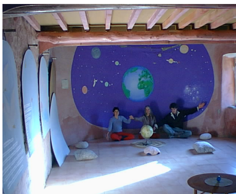
Cellule de visualisation, détachement

C'est tout un programme! En effet la DOUCEUR exclut toute violence, toute cruauté. C'est un état de Paix, de Calme, de Sérénité.